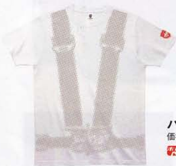
ハーネスTシャツ 価格3990円 ホビダス 51801216

ホビダス http://www.hobidas.com/ にアクセスし7桁のホビダスナンバーを入力すると、商品画面に行けます。(携帯電話からはアクセスできません)