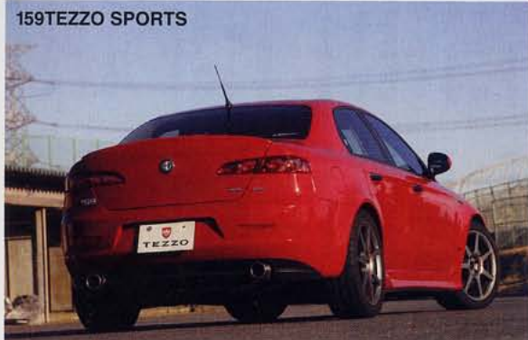
159には純正でTEと呼ばれるスポーティバージョンがあるが、こちらはTEZZO流TEと呼ぶ。エアロ、ホイール、マフラーに違いを見出せるが、見えない部分では足まわりに注目したい。

ホビダス http://www.hobidas.com/ にアクセスし7桁のホビダスナンバーを入力すると、商品画面に行けます。 (携帯電話からはアクセスできません)