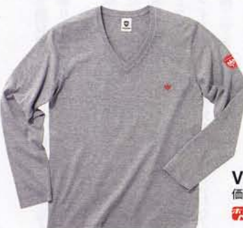
VネックTシャツ 価格4990円 ホビダス 51801218