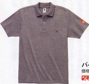
バードポロシャツ 価格5460円 ホビダス 51801217