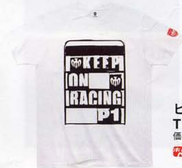
ピットボードタイプ Tシャツ 価格3990円 ホビダス 51801215